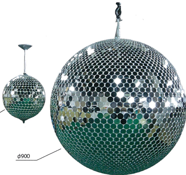
比較対象 NMB-3224P (φ305) 掲載P2